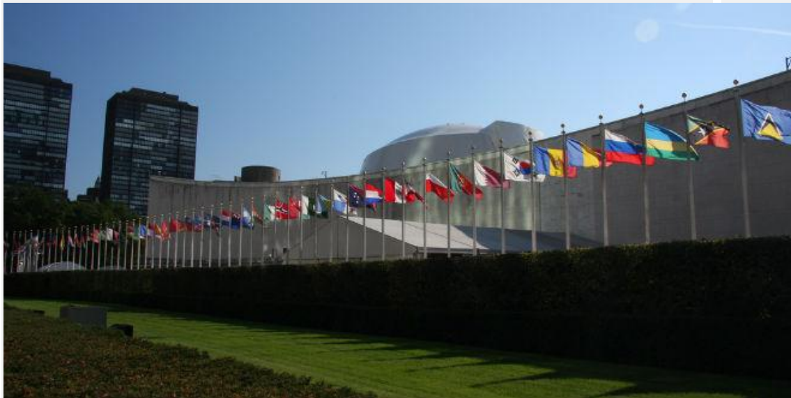
La fila de banderas de los países miembros de las Naciones Unidas frente al edificio de la Asamblea General de la ONU en New York.