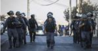
La policía de la Guardia de Fronteras israelíes en Jerusalén

Etiquetas: palestina terror , Jerusalén , disparos , Binyamin Netanyahu , Gilead Erdan ,